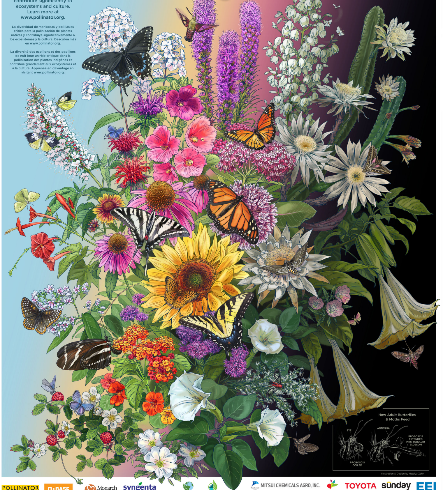
How Adult Butterflies & Moths Feed

La diversité des papillons et des papillons de nuit joue un rôle critique dans la pollinisation des plantes indigènes et contribue grandement aux écosystèmes et à la culture. Apprenez-en davantage en visitant www.pollinator.org .